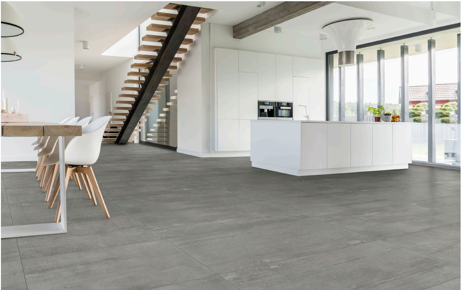
FUMO (Gris pâle)